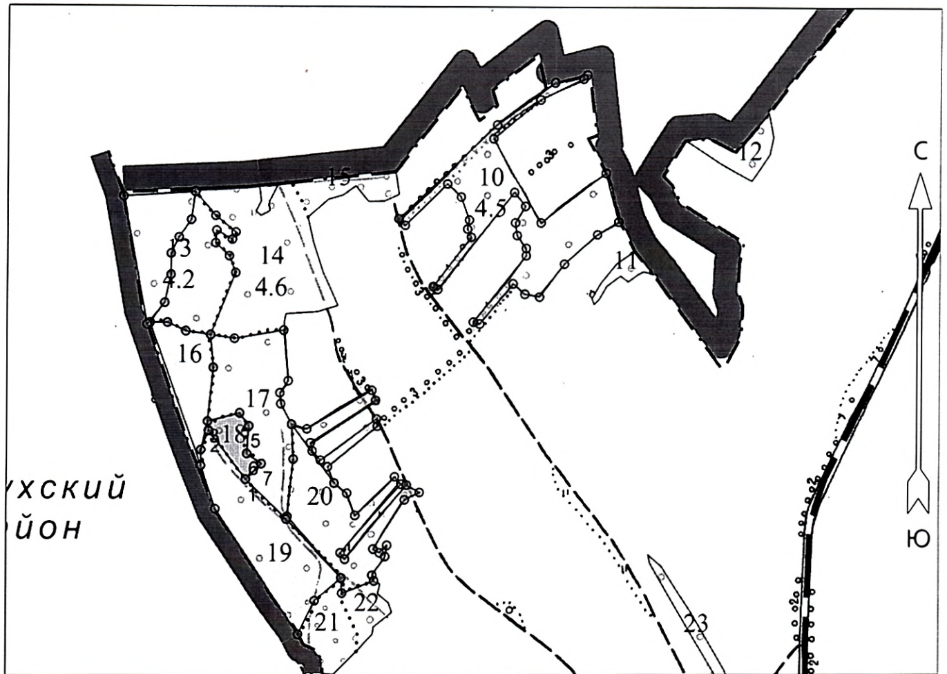
Схема разработки лесосеки Масштаб: 1 : 10000